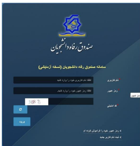
تصویر شماره یک

توجه داشته باشید نام کاربری افرادی که قبلاً ثبت نام کرده اند کد ملی می باشد .