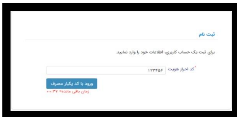
تصویر شماره ۳

نکته مهم : کد احراز هویت فقط و فقط به شماره همراه که به نام خود دانشجو باشد ارسال می گردد .